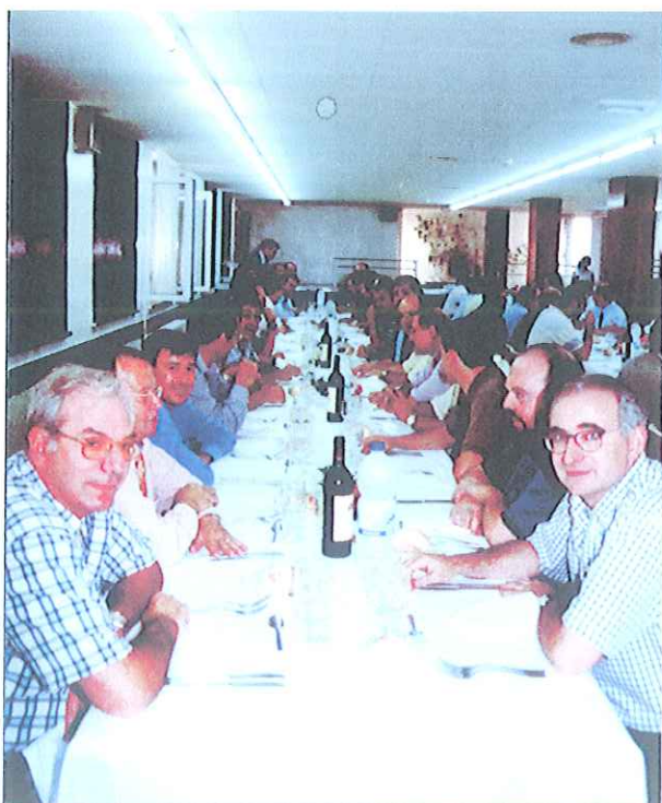
Los recuerdos, la amistad, la alegría y el buen humor fluyen en una mesa compartida

«EL EQUIPO de Fútbol Sala del Colegio quedó campeón de su grupo y subió de categoría. ¡A ver como se portan en la nueva división!»